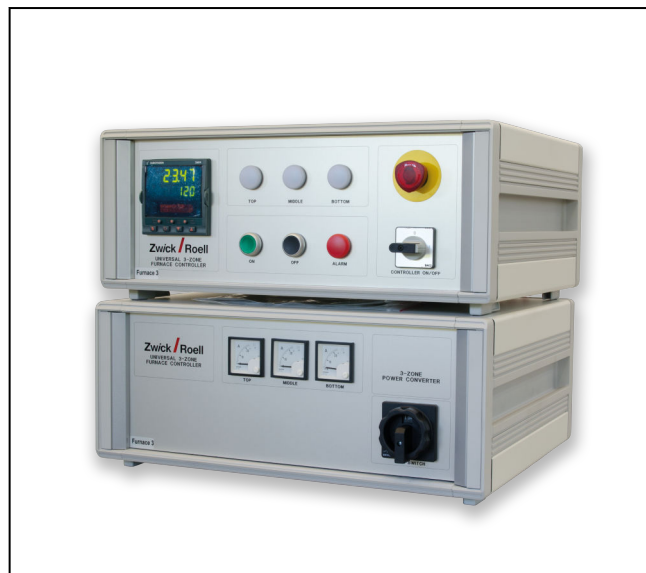
Schalt- und Regelanlage für Hochtemperatur-Rundöfen