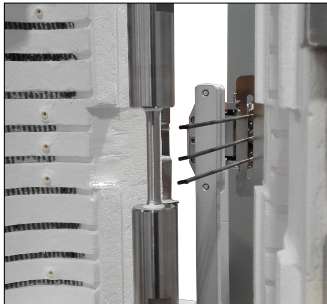
Probentemperatur-Messvorrichtung der Baureihe Variabel