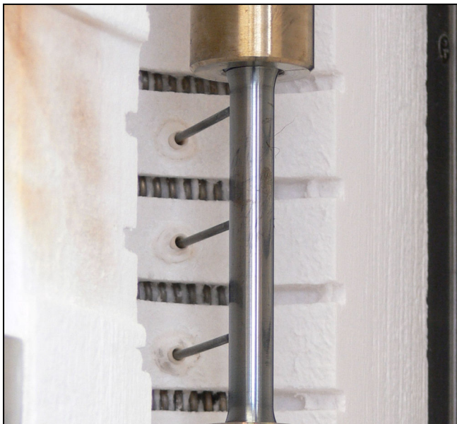
Probentemperatur-Messvorrichtung der Baureihe Fix

Zur Messung der Probentemperatur direkt an der Probe wird eine Probentemperatur-Messvorrichtung eingesetzt.