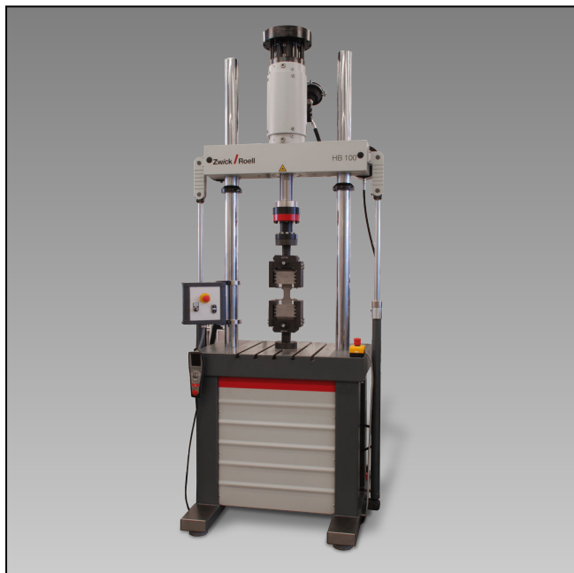
HB100 mit T-Nutenplatte und mechanischen Probenhaltern